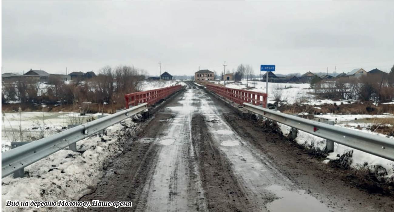
Вид на деревню Молокову. Наше время

Настоящая статья является кратким обзором истории жизни деревни Молоковой Зайковского поселкового совета Ирбитского района.